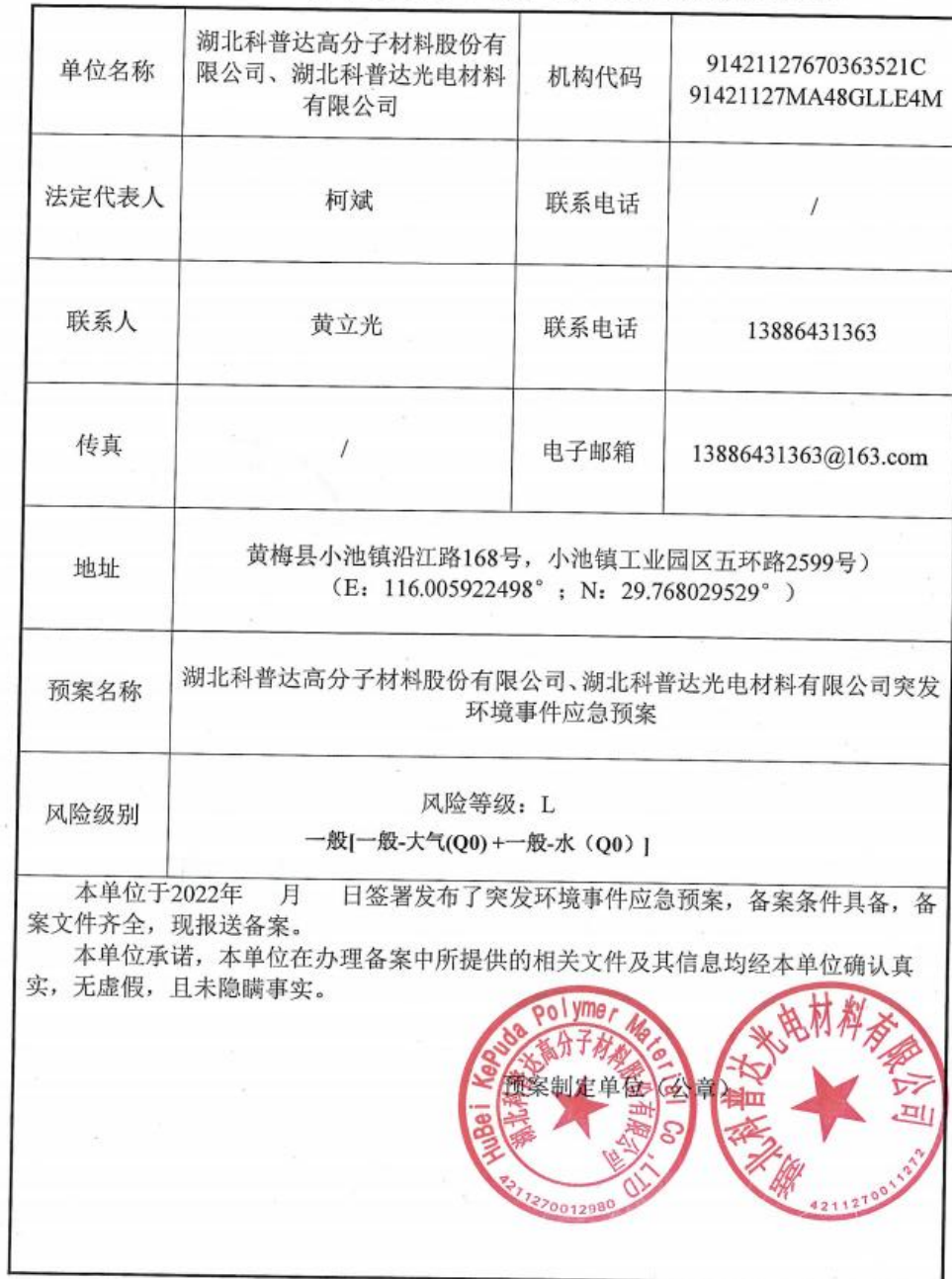
企业事业单位突发环境事件应急预案备案表