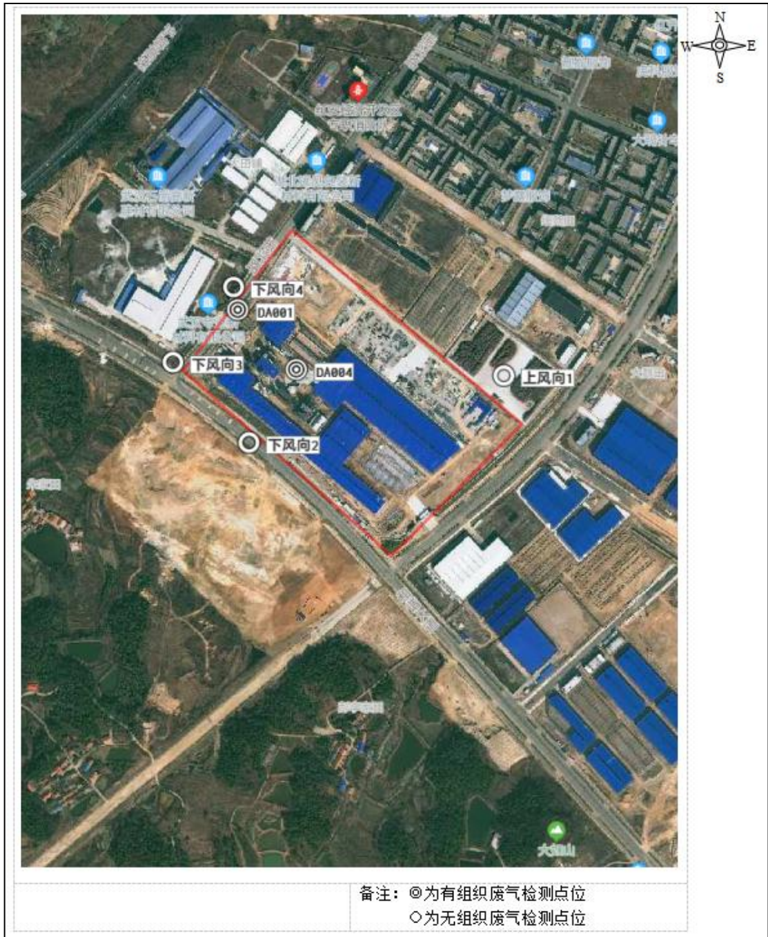
附图 6-2 项目监测点位图