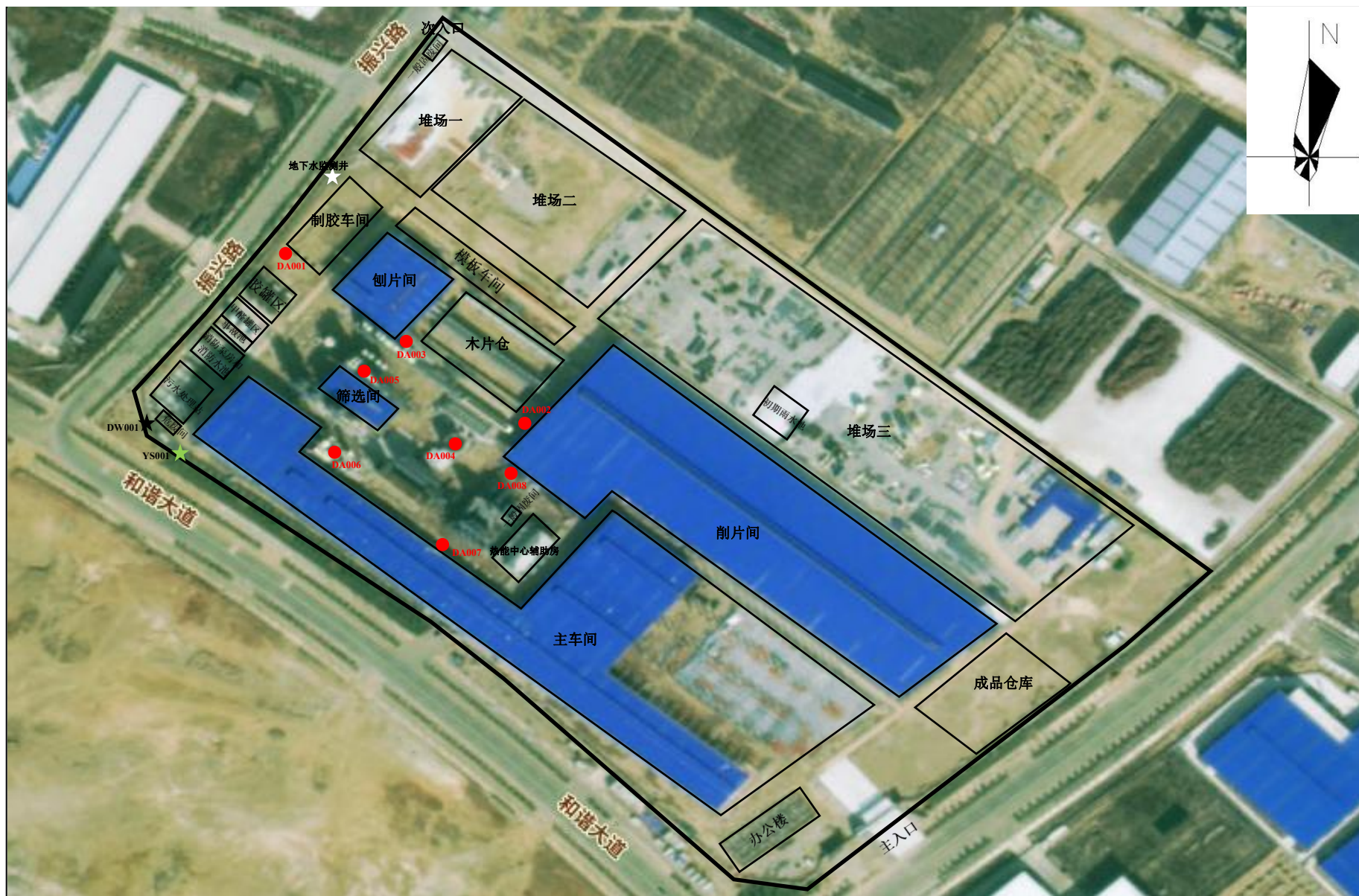
附图3 项目平面布置图