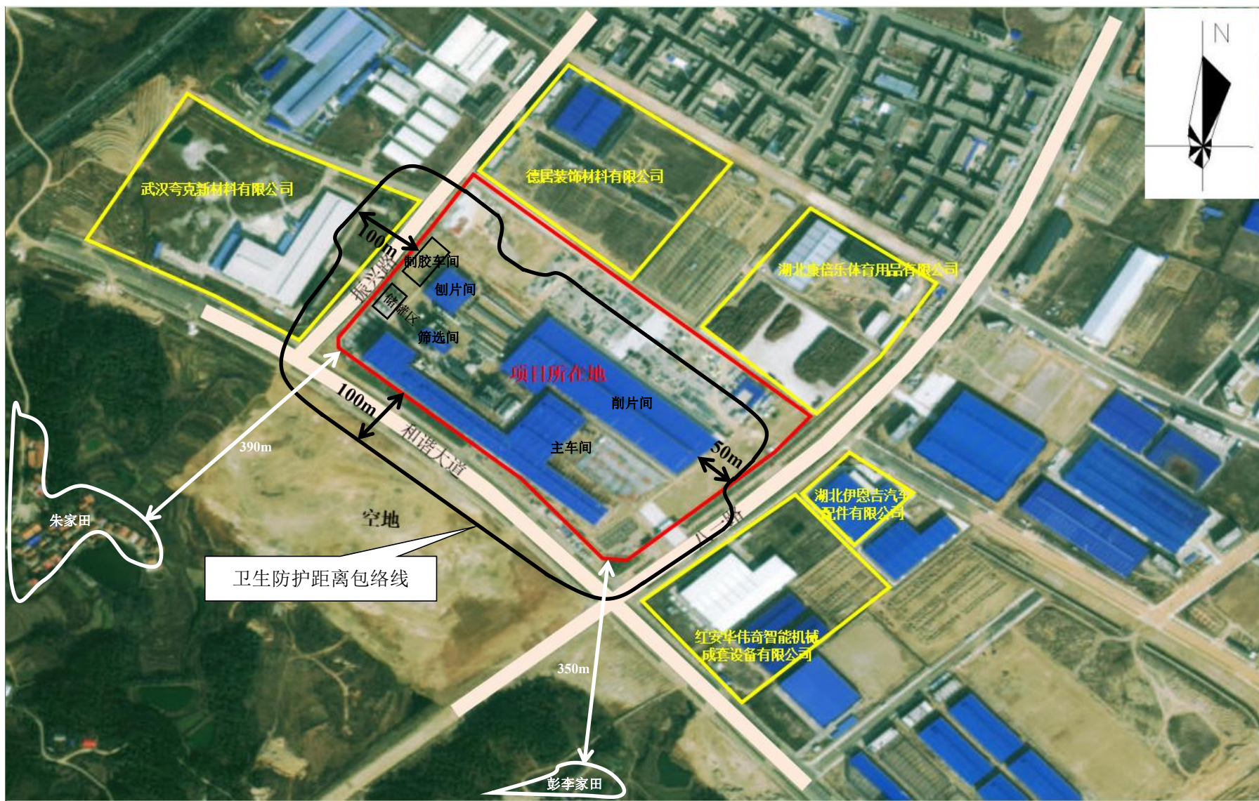
附图 7 项目卫生防护距离包络线图