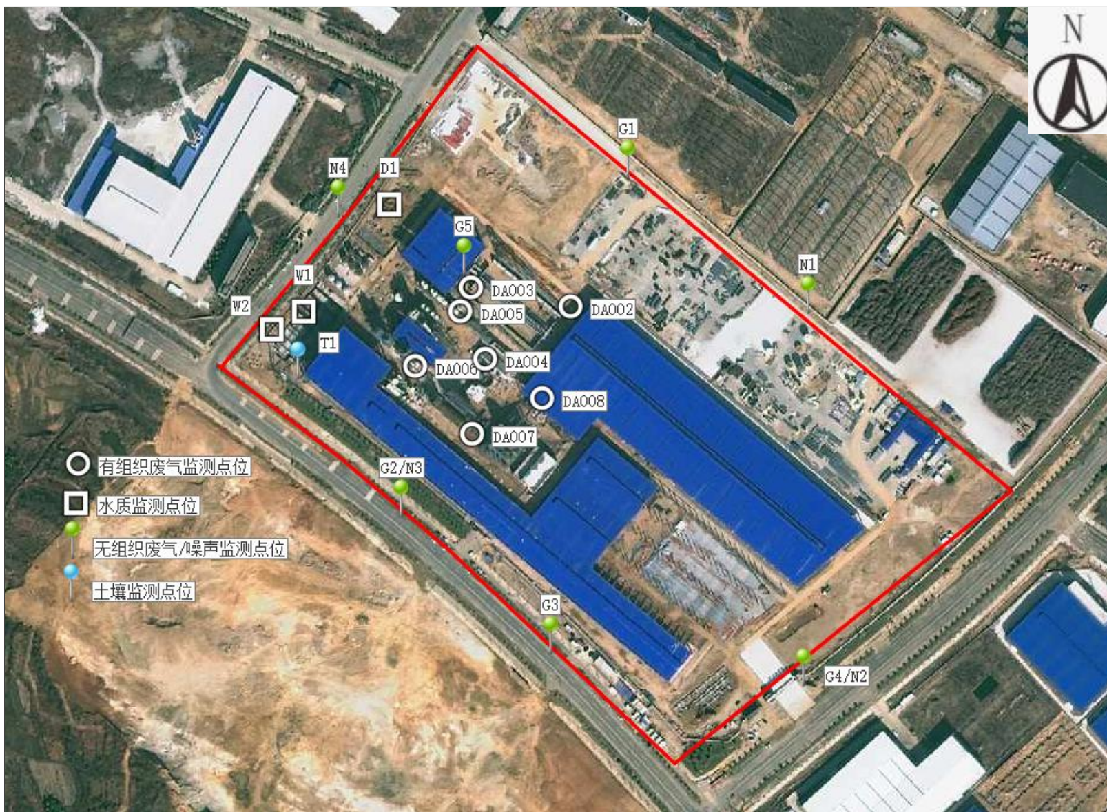
附图 6-1 项目监测点位图