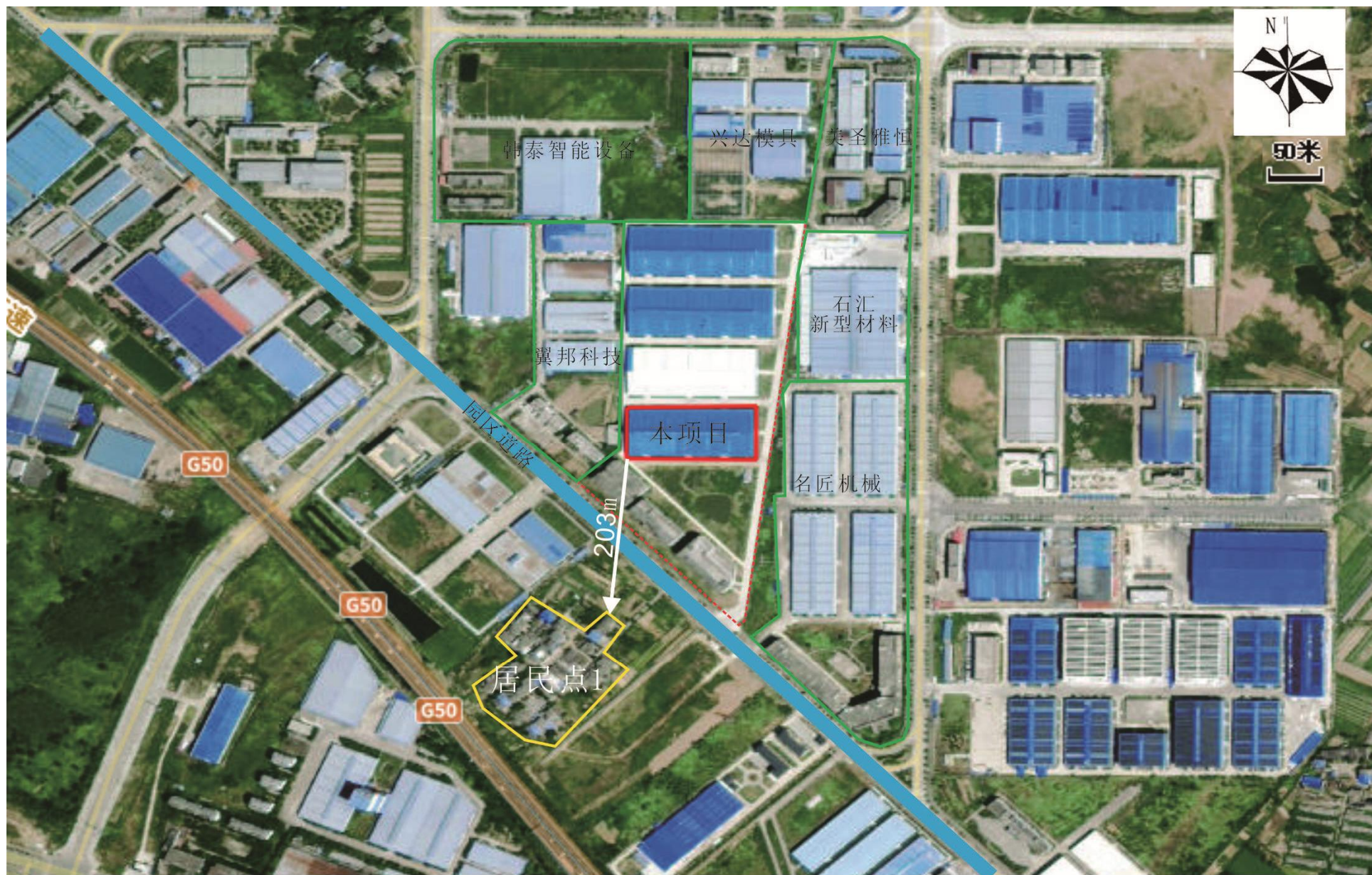
附图2 项目周边环境示意图