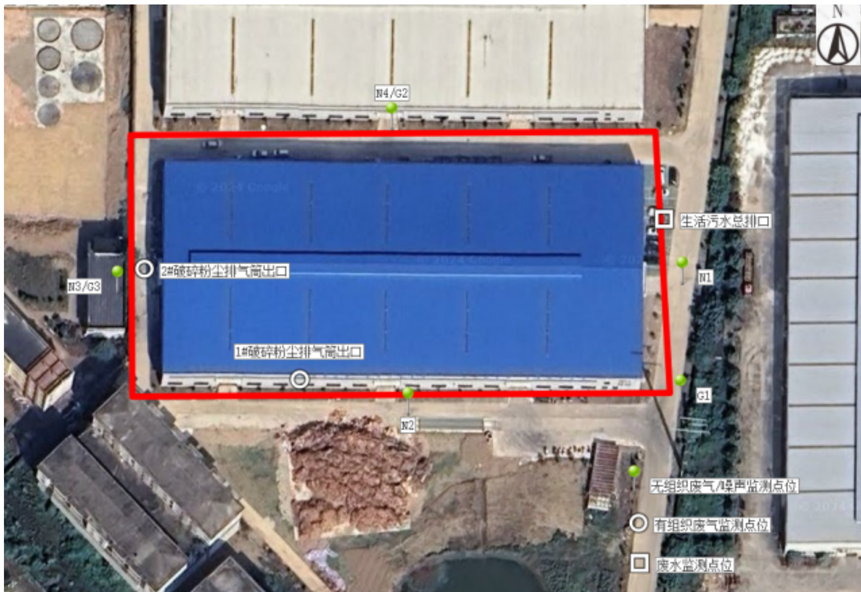
附图 4 项目验收监测点位图