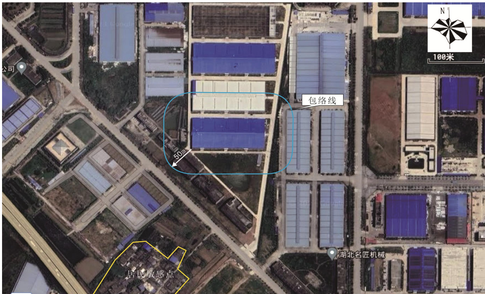
附图5 项目卫生防护距离包络线图