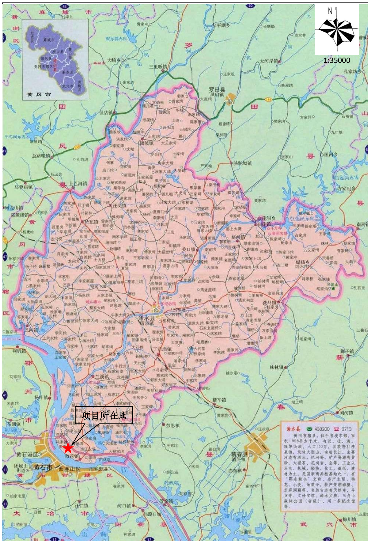
附图1 项目地理位置图