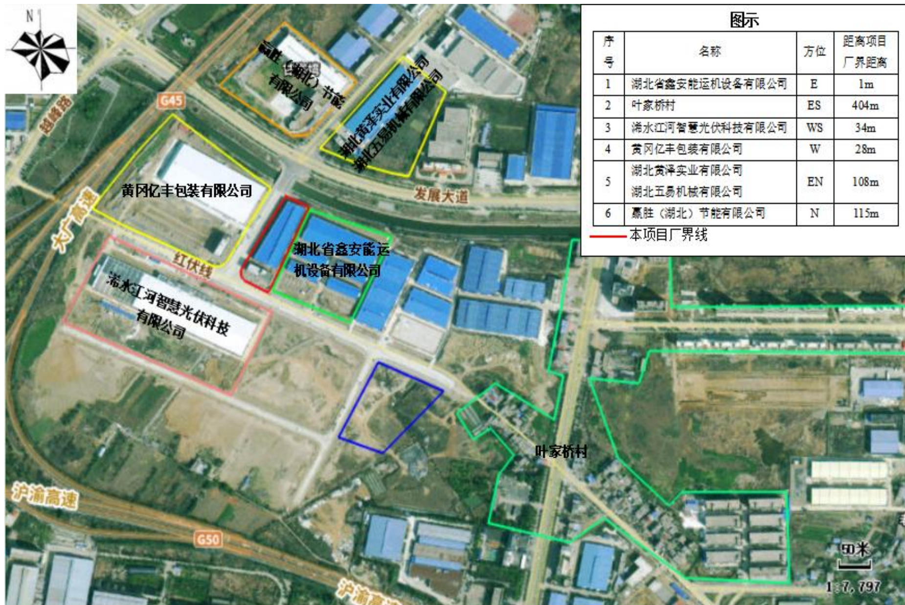
附图2 项目周边环境关系示意图