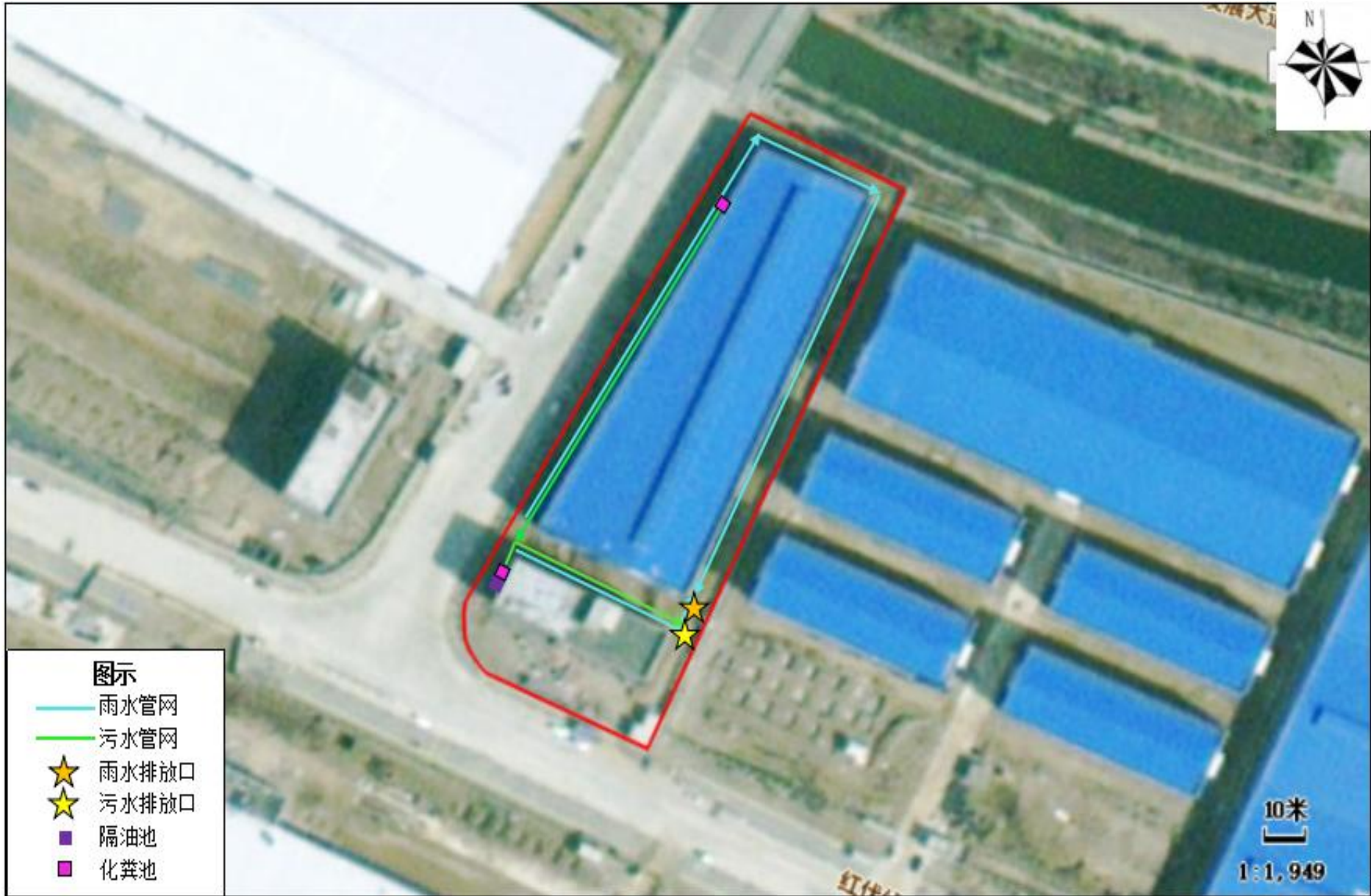
附图 4 项目雨污管网图