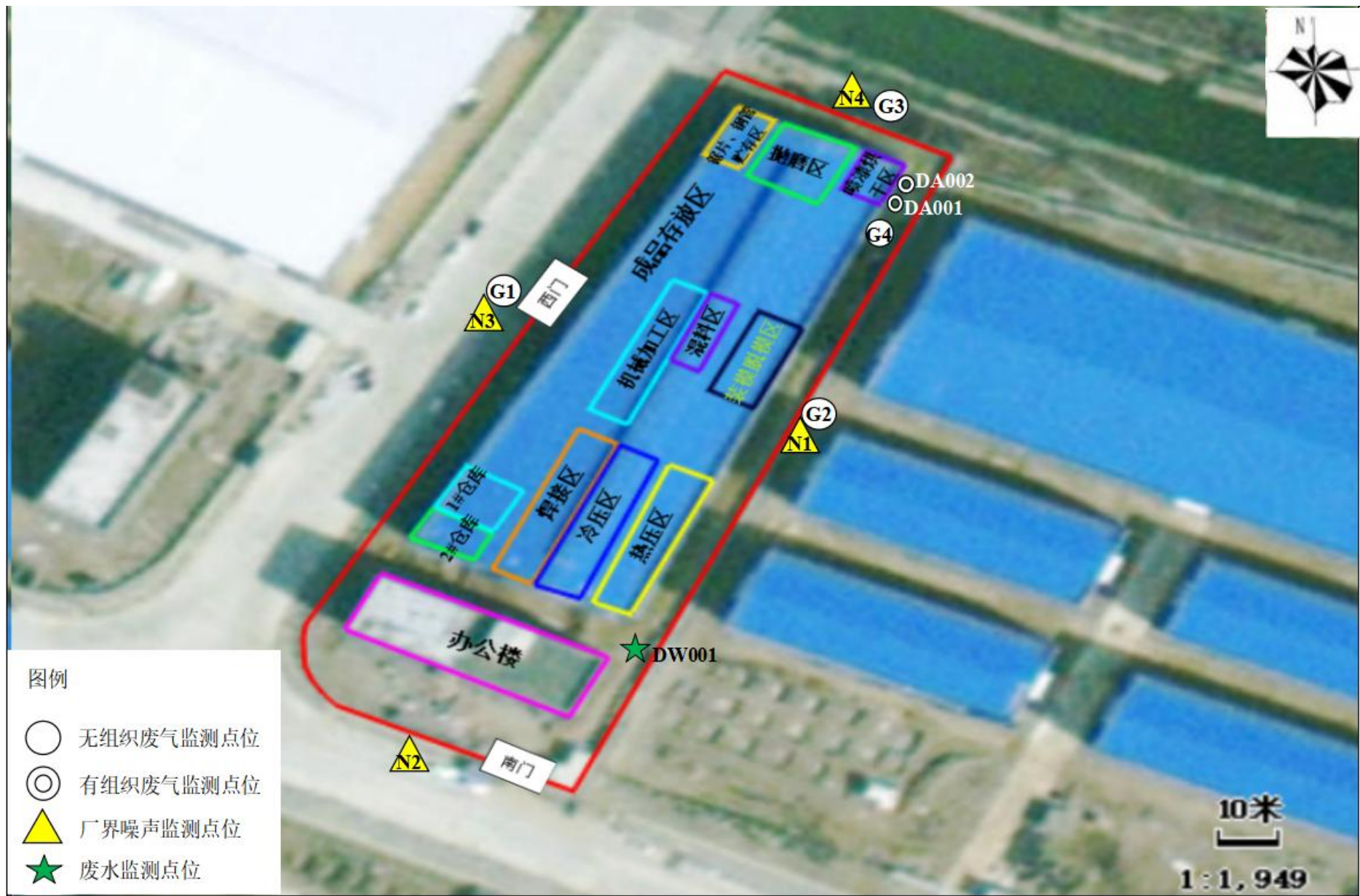
附图5 项目验收监测点位图