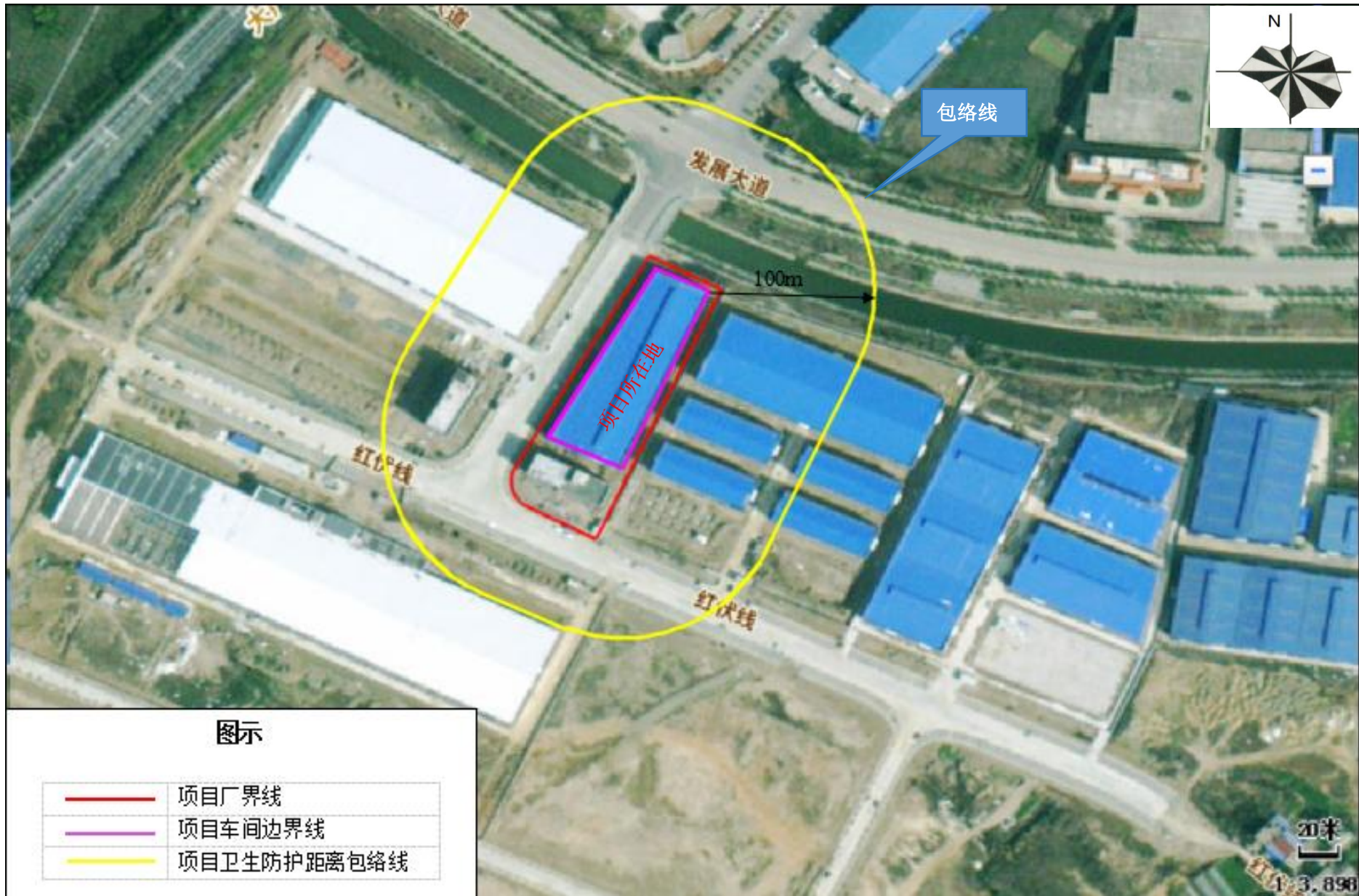
附图 7 项目卫生防护距离包络线图